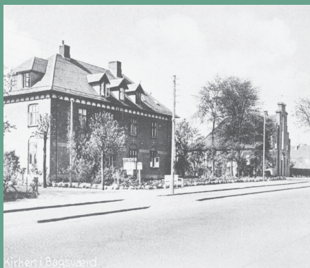
Kirken i Bagsværd

Der kom flere og flere mennesker til Bagsværd og bydelen blev stor. Folk ville virkelig gerne have en kirke i Bagsværd, som var stor nok, og for cirka 50 år siden besluttede man endelig, at bygge den kirke vi kender nu.