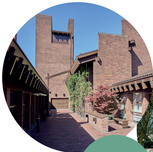
To moderne kirker. Lindehøj og Buddinge kirke.